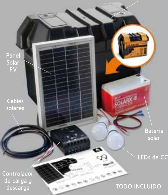
Panel Solar PV