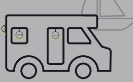
CARAVAN & MARINE